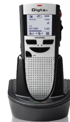
Mit Digta Station (auch als WLAN oder LAN-Station)