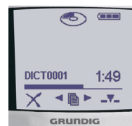
Übersichtliches Display im Easy-Mode